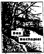
Gewässergütebestimmung auf dem Wasserwerk... für Umwacht, Wasserrecht, Freizeit.

Modellbach, Angeln, Magnete und sonstige Spielmaterialien im Karton. Preis: DM 20,-